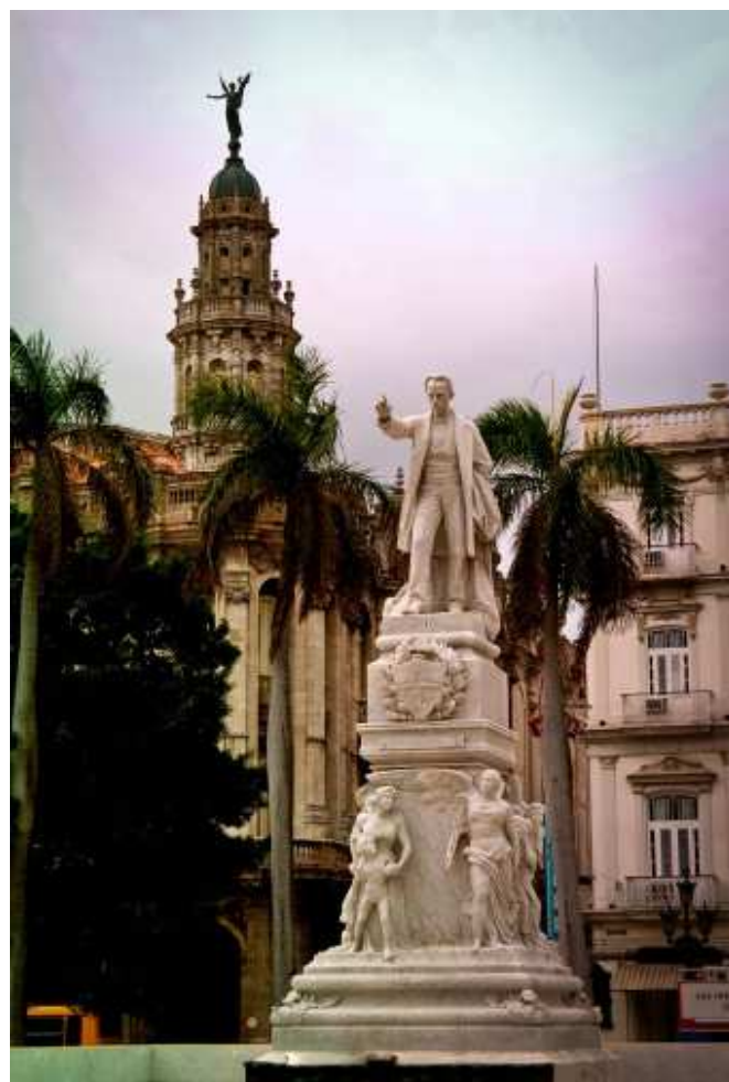
Estatua de José Martí en el parque central, La Habana.

para un momento de descanso y reflexión o para encontrar otra estrategia menos violenta. «Se me argüirá por quien leyese que Prío —siendo Ministro del Trabajo— desplazó a los comunistas de la CTC. Sí; pero no lo hizo por anticomunista. No cabían dudas que estos eran minoría, en el seno del obrerismo y se empeñaban en mantener sus posiciones rectoras. Un conjunto de variados elementos se tenía como antecedente, para haber adoptado la posición que asumió Espacio Laical # 2. 2016 81 Prío. Ninguna, lo aseguro, el anticomunismo. Y la decisión administrativa del Ministro del Trabajo, por otra parte, estaba sujeta a los Tribunales»7.