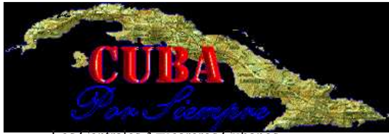
Los Centrales Azucareros Cubanos

"El Arroyo que Murmura" es Cantado por Guillermo Portabales en un formato de MP3 - Para poderla oír espere unos segundos mientras es bajada.