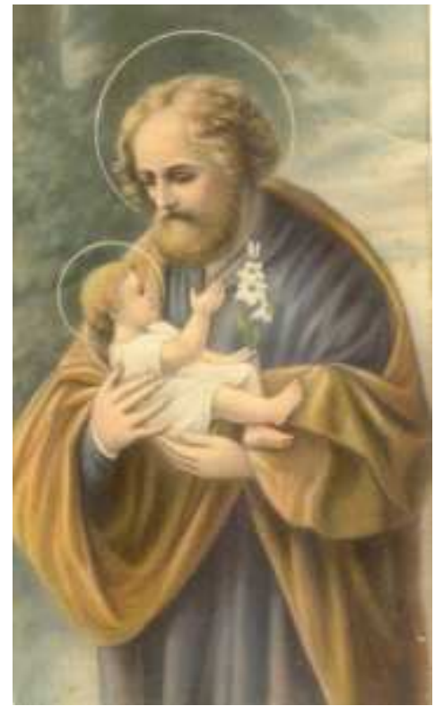
Nuestro Santo Patrón de Camajuani, San José.