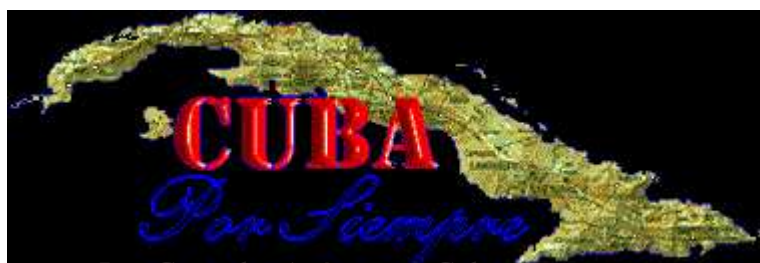
Los Centrales Azucareros Cubanos

"El Arroyo que Murmura" es Cantado por Guillermo Portabales en un formato de MP3 - Para poderla oír espere unos segundos mientras es bajada.