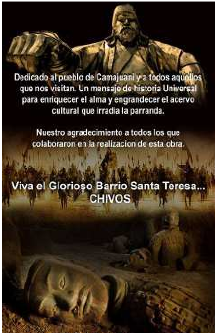
Yuniet Cid: Con todo el arte y buen gusto les dejo con el souvenir del barrio más grande y glorioso .chivos