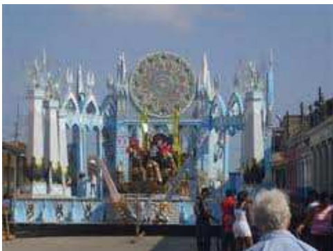
Carroza " Cleopatra y Marco Antonio ", del barrio Sapos, año 2010