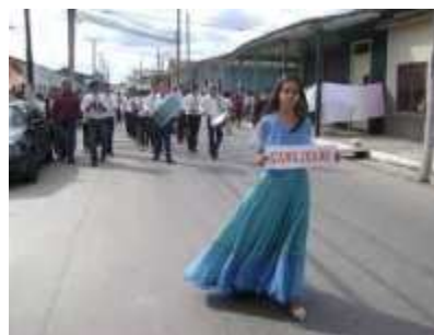
Parada Municipal de Camajuaní, con su banda Municipal

Museo Hermanos Vidal Caro: Libros de Actas de constitución del ayuntamiento de Camajuaní, s.n., s.a., Camajuaní.