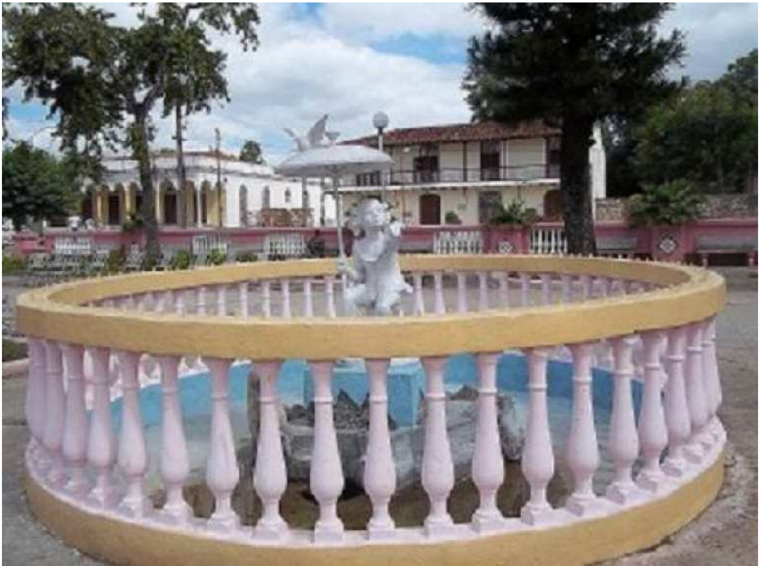
La fuente en nuestro parque Leoncio Vidal.

Año. XXIII. Miami, Florida. USA. (2013) No. 74