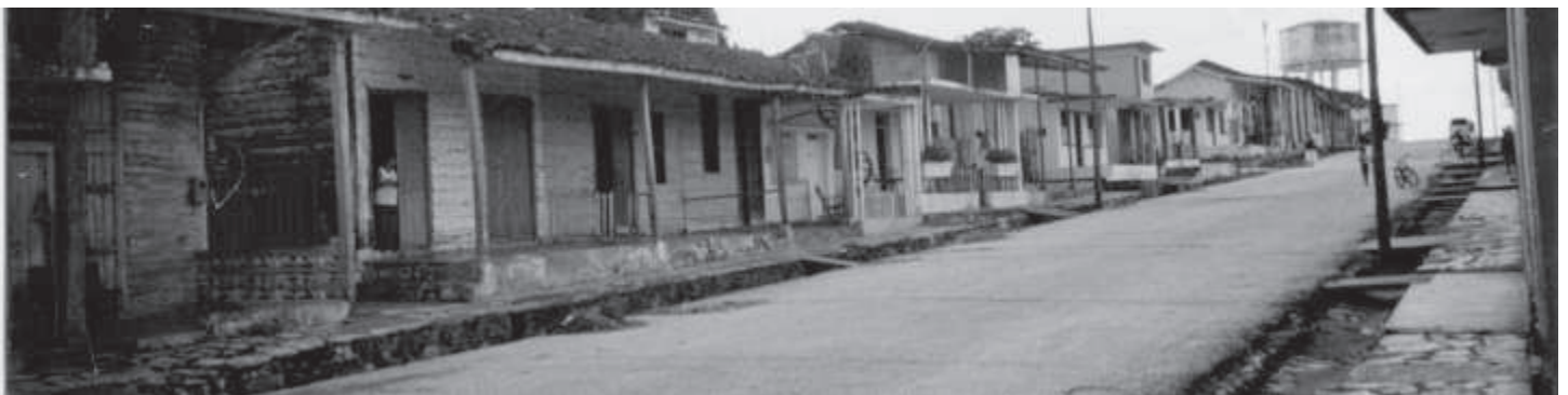
Vista de la Calle Leoncio Vidal, entre Santa Teresa y Luz Caballero.